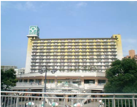
Appearance of the building