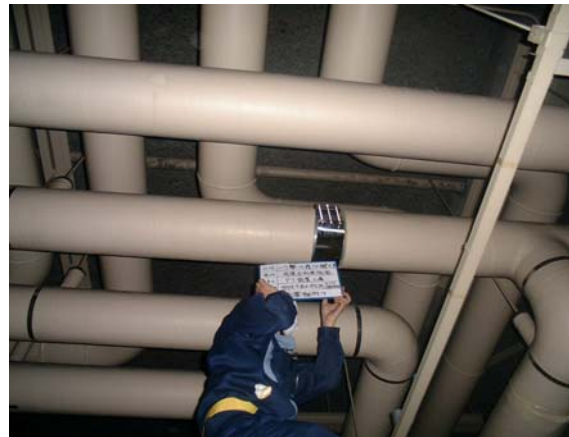
On outlet of the hot and cold water pipes